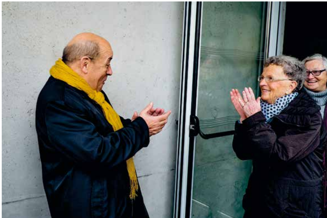
Jean-Yves Le Drian, candidat PS et Ministre de la Défense croise une sympathisante alors qu'il va voter dans sa commune de Guidel (Morbihan).