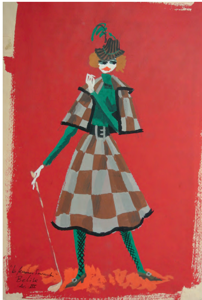
Gouaches de Claude Bessou (1960) pour les costumes d'Armande et Belize dans Les Femmes savantes de Molière