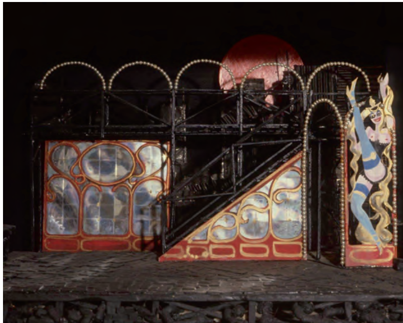
Maquette de Tambours dans la nuit de Bertolt Brecht, mise en scène de Pierre Spadoni pour le Théâtre du Bout du monde, en 1974