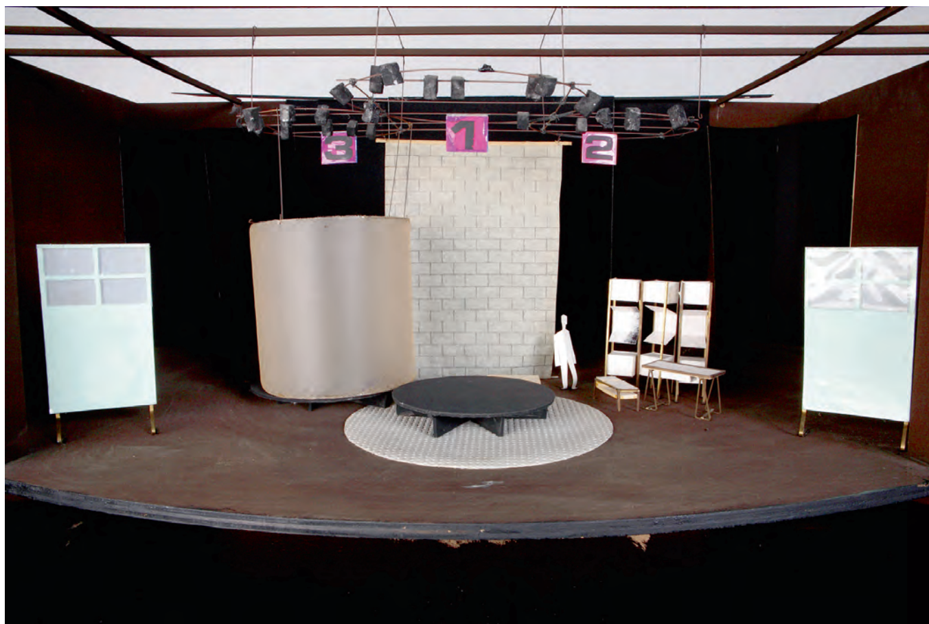
Maquette du décor de Biographie, jeu théâtral , mise en scène de Guy Parigot (1969)