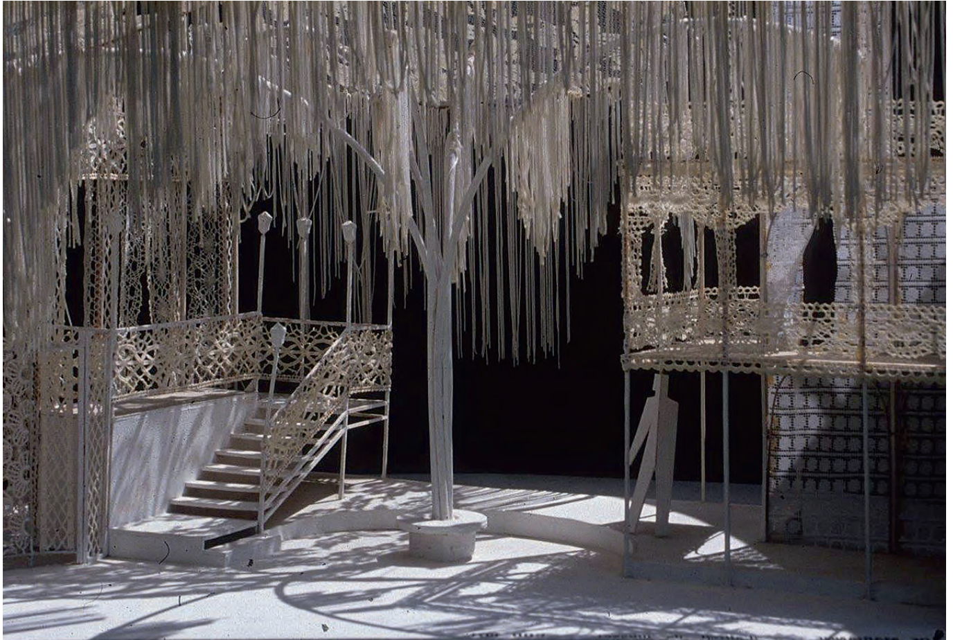
Maquette des Caprices de Marianne d'Alfred de Musset, mise en scène de Guy Parigot en 1971 pour la CDO (Coll Privée)